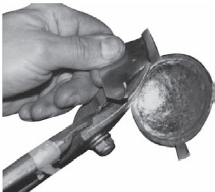
Uitknippen met een bliksschaar

Koper drijven tot aan de stippellijn! Met een bliksschaar of figuurzaag (metaalblad) na het drijven langs de doorgetrokken lijn afknippen of afzagen!!!