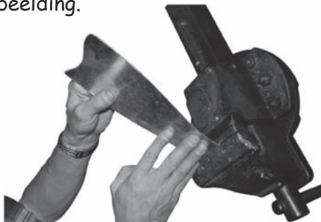
10 mm van de rand ombuigen

Span eerst de grondplaat 10 mm diep in een bankschroef en buig de plaat vervolgens in een hoek van 90 graden. Vervolgens de grondplaat met een spitsbektang opdraaien (zie afbeelding).