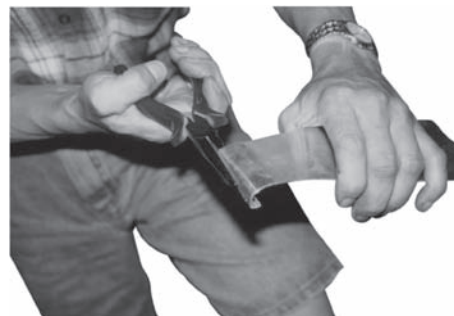
Daarna met een spitsbektang opdraaien!