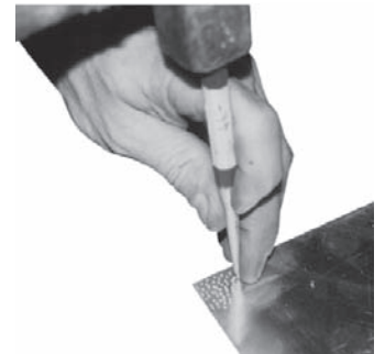
Ciseleren - naar eigen idee

Met een hamer en kraspen (of grote spijker) kun je in het metaal verschillende motieven aanbrengen. In de grijs gemarkeerde vlakken (zie tekening) kun je naar eigen ideeën het metaal bewerken. Leg het metaal op een harde ondergrond. Gebruik je creativiteit en verzin een origineel patroon of figuur!