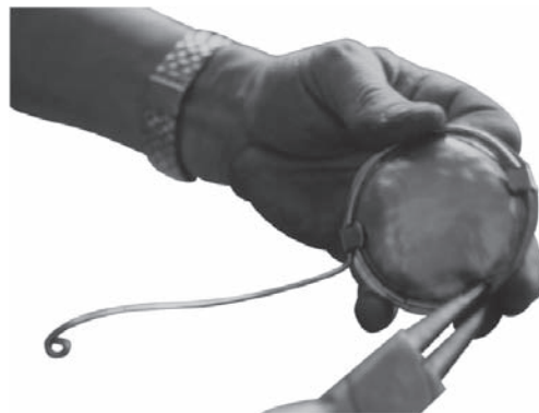
Lasdraad met de lipjes bevestigen

lasdraad een schroefvoog. Dit schroefvoog kan vervolgens met een schroef op de grondplaat vastgezet worden.