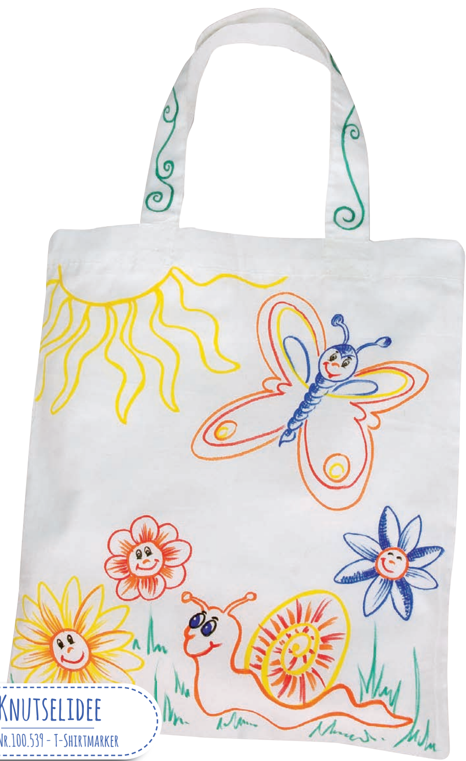
KNUTSELIDEE NR. 100.539 - T-SHIRTMARKER

Na 24 uur is de kleur gefixeerd. Door strijken kan de fixatie worden versneld. Het textiel kan vervolgens worden gewassen op maximaal 60°C.