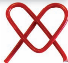
het overtollige stuk afknippen