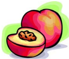
_____ Pfirsich _____