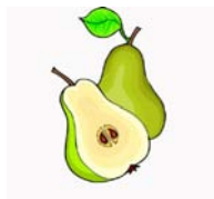
_____ Birne _____