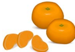
_____ Mandarinen _____