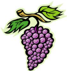
_____ Weintraube _____