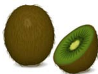
_____ Kiwi _____