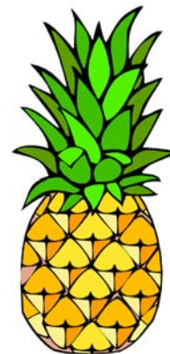
_____ Ananas _____