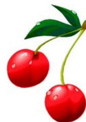
_____ Kirsche _____