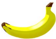
_____ Banane _____