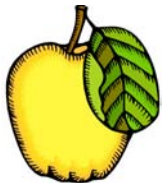
_____ Apfel _____

Schrijf de juiste naam op de lijn eronder!