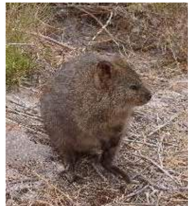
Quokka, ook een kangoeroe soort