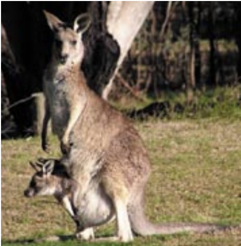
Oostelijke grijze reuzenkangoeroe

Bij de geboorte zijn de baby kangoeroes 2 cm lang en slechts 1 gram zwaar. Ze kruipen zelfstandig naar één van de vier tepels en zuigen zich vast. De tepel laten ze pas 2 tot 3 maanden later weer los.