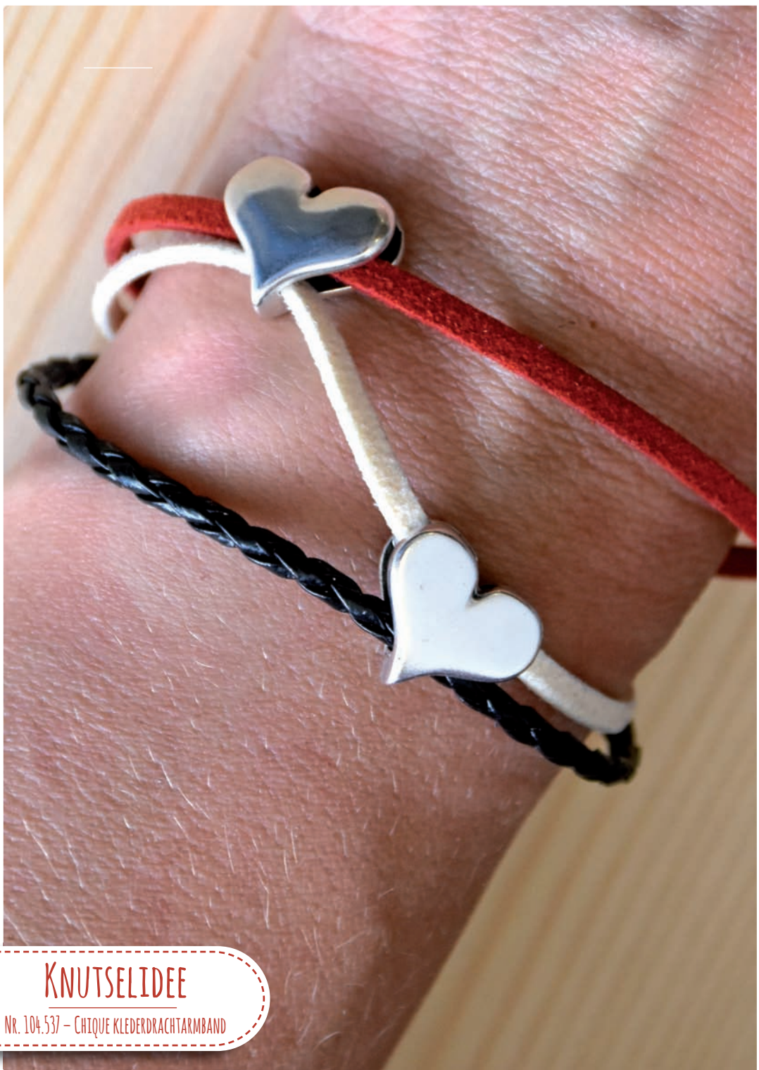
KNUTSELIDEE Nr. 104.537 – CHIQUÉ KLEDERDRACHTARMBAND