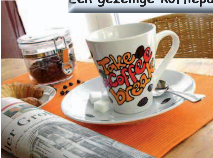
Een gezellige koffiepauze