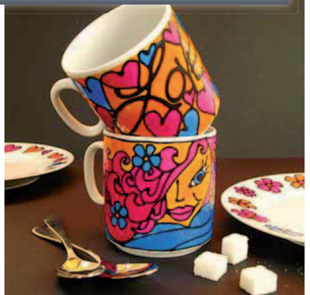
Voor de jongeren en jonge geliefden