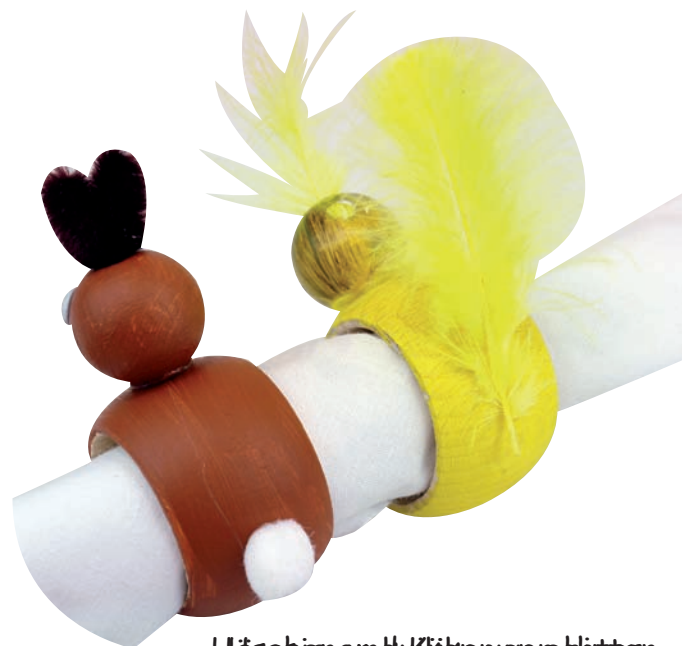
Haasje en Kuiken voor kinderen

Daarna nog met Fineliner of met een andere watervaste stift een gezicht optekenen en je servethouder is paashaasvorm is klaar.