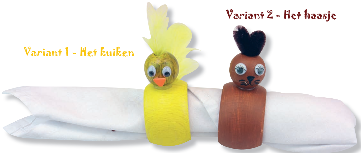
Variant 2 - Het haasje

Versier je Paastafel met mooie servetringen passend bij Pasen. Deze zijn niet alleen leuk en grappig, maar ook zeer decoratief en eenvoudig om na te knutselen. Aduis wensen u veel plezier met het naknutselen.