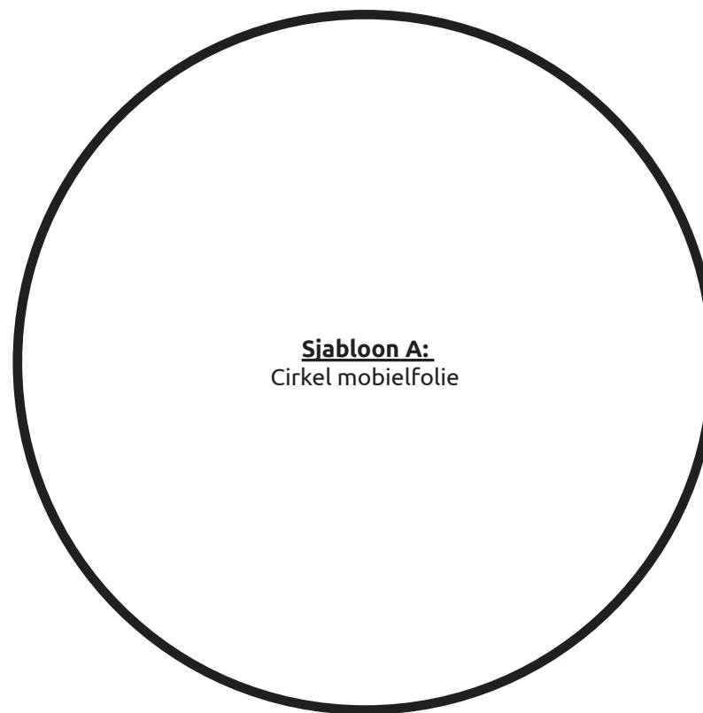
Sjabloon A: Cirkel mobiel folie