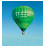
om zich te verplaatsen