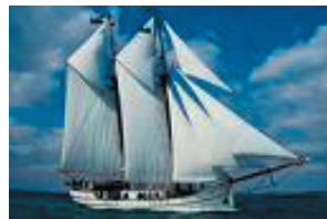
om te varen