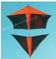
om te vliegen