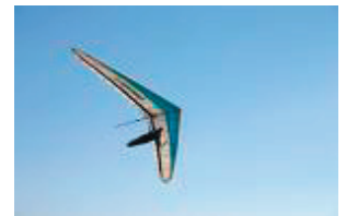
om hoogte te winnen