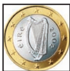
Harp op het Euro muntstuk.

Grootte: 70 300 km 2 Bevolking: 4,3 miljoen Hoofdstad: Dublin