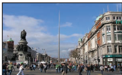
die Hauptstadt Dublin

De Kanaaltunnel verbindt Engeland met het vasteland van Europa. Voor het 50 km lange traject (ongeveer 40 m onder de zeebodem!) hebben de treinen slechts 35 minuten nodig!