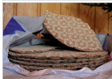
Typisch Zweeds: Het knäckebröd