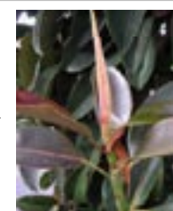
De rubberboom als kamerplant