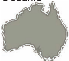
Australië + Oceanië

Dit continent heeft het kleinste opperv-