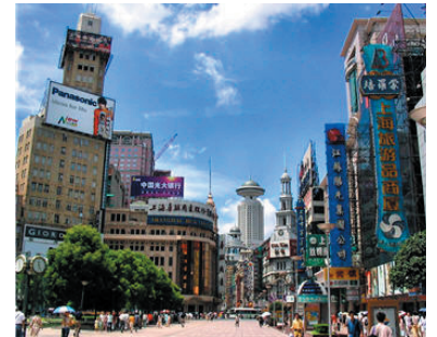
Sjanghai - Nanjing-Road

Dit is maar een fractie van de informatie over Sjanghai die je op Internet kunt vinden. Dit werkblad legt echter uit waarom je werkstuk "de toren van Sjanghai" wordt genoemd.