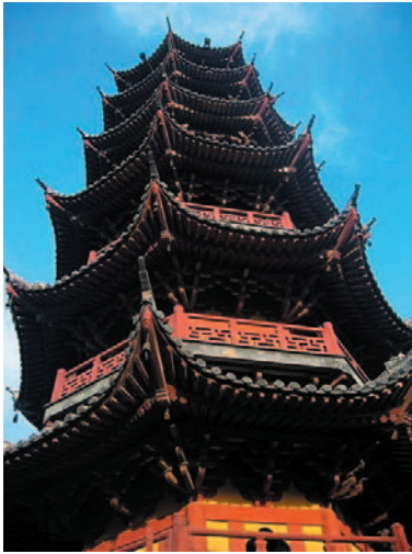
Long-Hua-Pagode, voormalig tolgebouw

Sjanghai is de grootste stad van China en betekend in het Chinees "boven zee". De stad telt in 2005 naar schatting 14.6 miljoen inwoners in een gebied van ruwweg de provincie Utrecht! De stad is dus heel dicht bevolkt en groeit nog steeds verder. Hoe woon je daar? Bovenop elkaar in wolkenkrabbers.